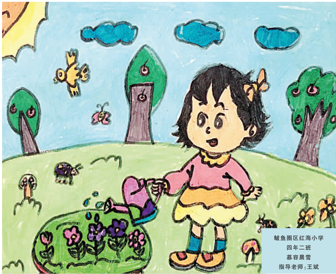
鲅鱼圈区红海小学 四年二班 慕容晨雪 指导老师:王斌