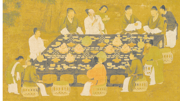
赵佶 宋 《文会图》局部

“（汉延平中）一千石月钱四千，米三十斛。”也就是说，像千石这样的官职，月薪为4000钱加30斛米，而腊赐为6000钱，大概也就相当于两个月工资吧！千石在汉代属于比较高的官职，至于那些百石以下的斗食吏，能领到的年终奖则少之又少了。 现在有不少企业将年终奖分两次发放，一次在年尾，一次在春节后或者有的干脆拖到了第二年的后半年。对于企业这样的“小心思”，东汉人说：这都是我玩剩下的！ 东汉不仅有年终奖，立春还有春赐，《汉官仪》记载：“立春之日，遣使者赐文官司徒、司空帛三十匹，九卿十五匹……”这不就相当于一整年有两次年终奖吗？ 冬春之际，一定是东汉最幸福的季节，没有之一。