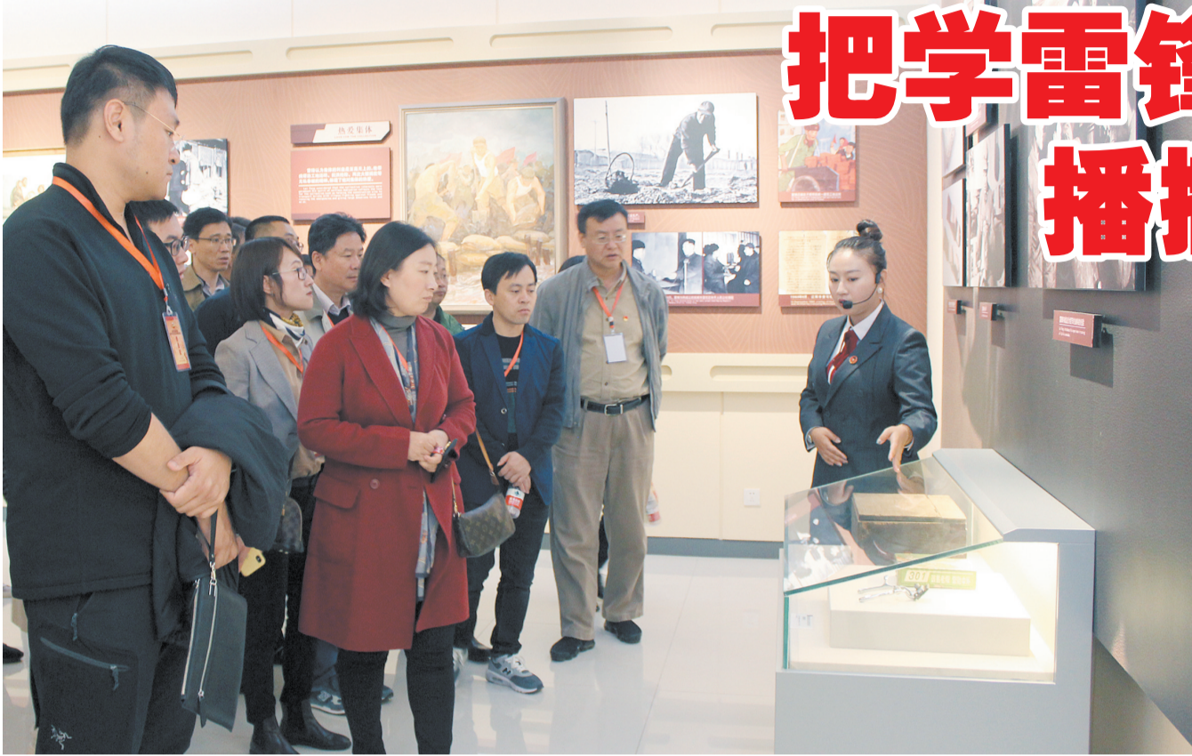
2019年10月，中国五矿集团支部书记团队参观市雷锋文化博物馆