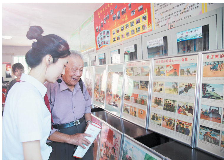
2020年9月17日，《“画说雷锋”主题宣传画展》走进南湖社区