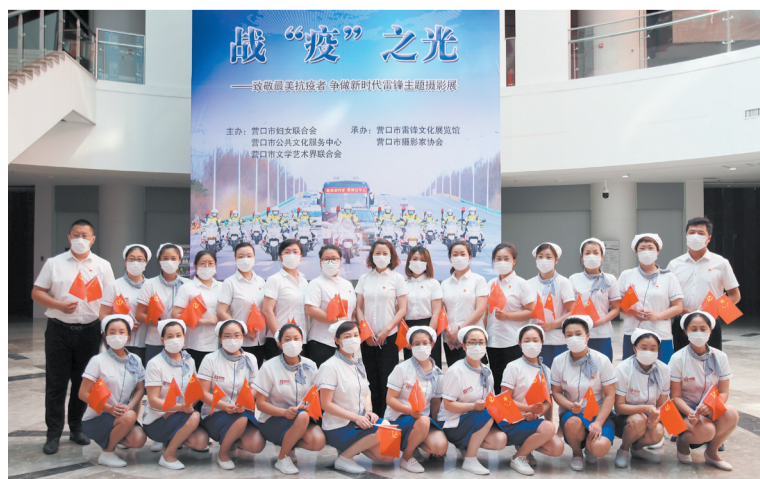
2020年7月1日，营口市成大方圆员工参观《战“疫”之光》主题摄影展

歌模范、体现时代精神的临时性展览。两年来，先后举办了《“雷锋文化 营口有礼”手抄报展》《“雷锋文化——永恒的风尚”主题书画展》《“画说雷锋”主题宣传画展》《“战‘疫’之光——致敬最美抗疫者，争做新时代雷锋”主题摄影展》《“祖国颂歌”宣传画展》以及今年为纪念中国共产党成立100周年即将举办的《永远跟党走》宣传画展等。