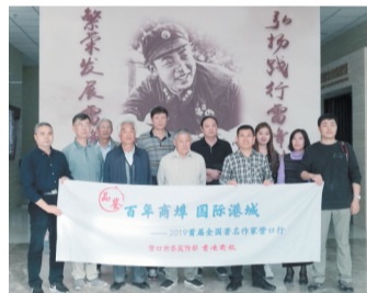
2019年9月19日，香港商报团队前来参观