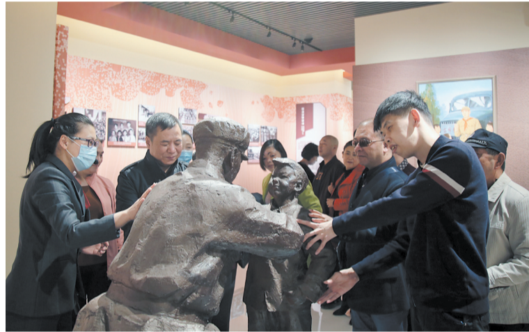
2020年10月13日，盲人团队参观展馆