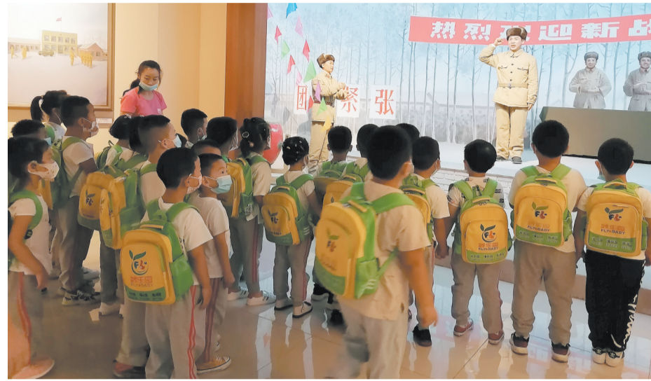
2020年9月17日，市翻乐园幼儿园小朋友前来参观

市雷锋文化博物馆（原市雷锋文化展览馆）对外开放两年来，通过举办主题鲜明的展览，开展形式新颖的活动，提供专业高效的服务，为提升城市文化环境助力。