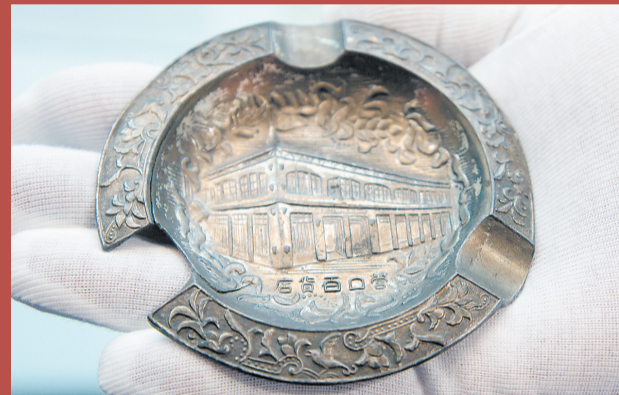
营口百货店烟缸 (民国)