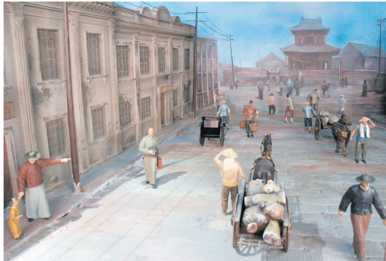
民国时期的西大街 (场景复原)