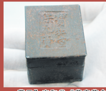
营口“宝和堂”药房药盒 (民国)