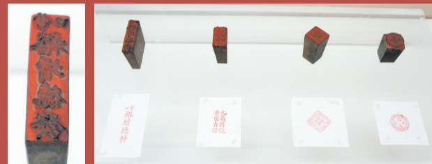
木刻“营口裕增德发”商号印 部分商号印章 (清)