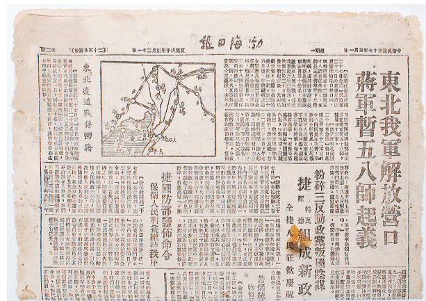
刊登营口解放消息的《渤海日报》