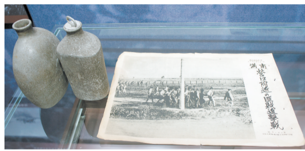
侵华日军的水壶、侵华日军的报纸 (伪满)