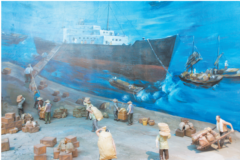
晚清时期的营口港 (场景复原)