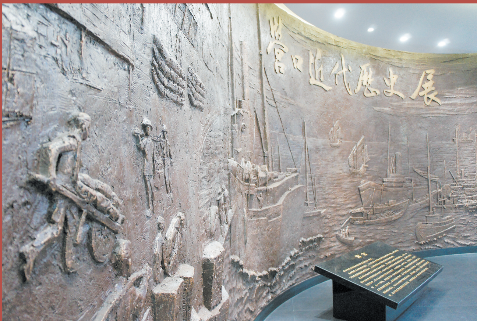
舳舻云集的远河码头 (展厅浮雕)