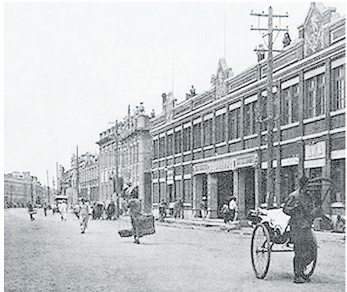
工商业繁荣的营口西大街