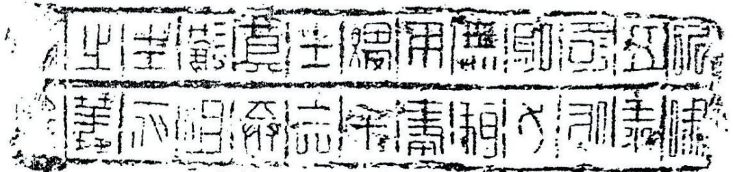
“永和五年”文字砖拓片