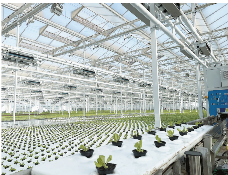
这是上合组织农业技术交流培训示范基地——占地700多亩的杨凌智慧农业示范园(2022年6月8日摄)。

守诺。上合组织医药合作发展大会召开、中国—上海合作组织经贸学院成立、中国—上海合作组织法律服务委员会揭牌、“丝路一家亲”行动框架内开展卫生健康、扶贫等领域的30个合作项目……一项项“中国承诺”扎根落地，收获的合作成果惠及各国人民。