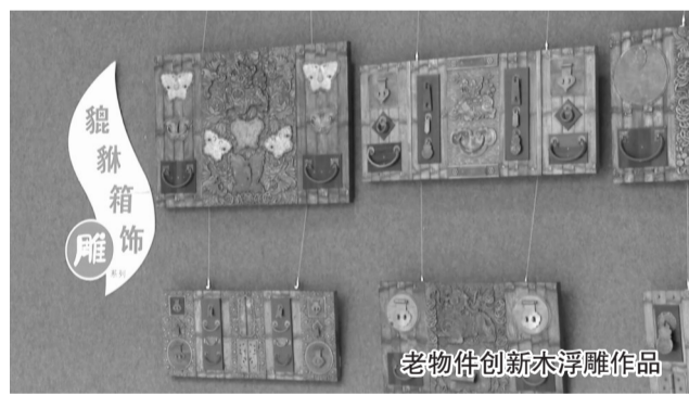
老物件创新木浮雕作品