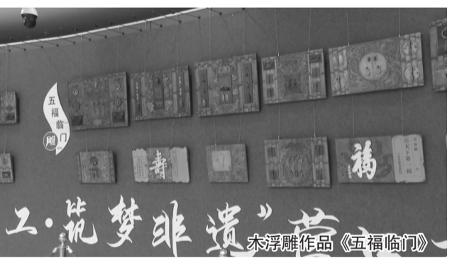
木浮雕作品《五福临门》