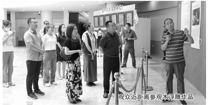
观众近距离参观木浮雕作品