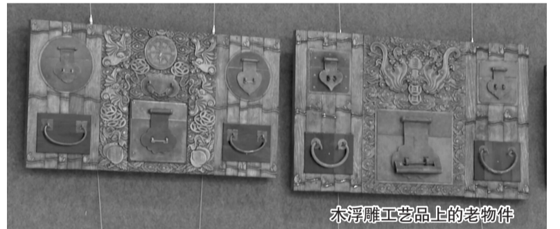
木浮雕工艺品上的老物件