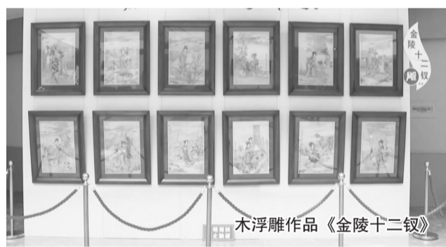
木浮雕作品《金陵十二钗》