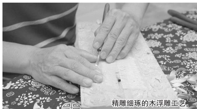
精雕细琢的木浮雕工艺