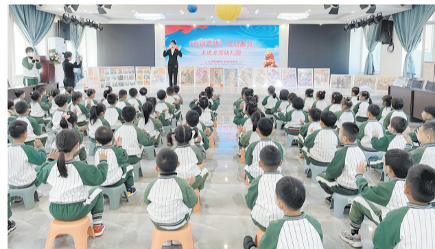
2022年11月1日，市雷锋文化博物馆举办的“画说雷锋”流动展览走进营口市龙湾幼儿园。