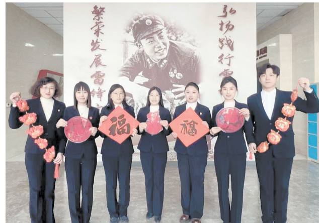
2024年2月9日，市雷锋文化博物馆全体员工为广大观众送上新春祝福。