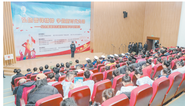
2020年12月18日，市雷锋文化博物馆与共建单位联合举办“纪念雷锋同志诞辰80周年”文艺演出活动。

5年来，市雷锋文化博物馆总计接待省内外团队1800多个、全国各地观众（含零散观众）170余万人次。展馆先后被命名为省级爱国主义教育基地、省级共青团志愿服务基地、省级少先队校外活动实践基地和市级学雷锋示范点、民族团结进步教育基地。