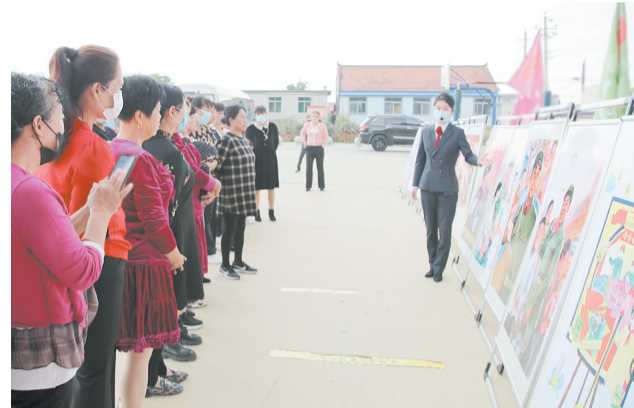
2021年9月29日，市雷锋文化博物馆举办的“画说雷锋”流动展览走进大石桥市虎庄镇杨家村。