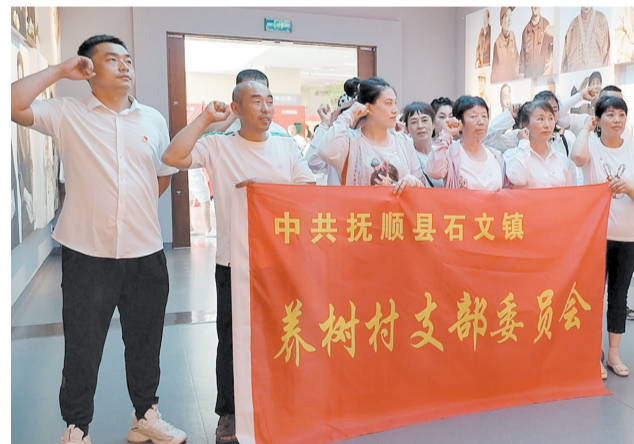
2023年7月2日，抚顺市抚顺县石文镇养树村党员到市雷锋文化博物馆参观。