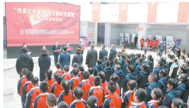
2024年3月5日，市雷锋文化博物馆与共建单位共同开展“传承红色基因 争当新时代雷锋”主题活动。