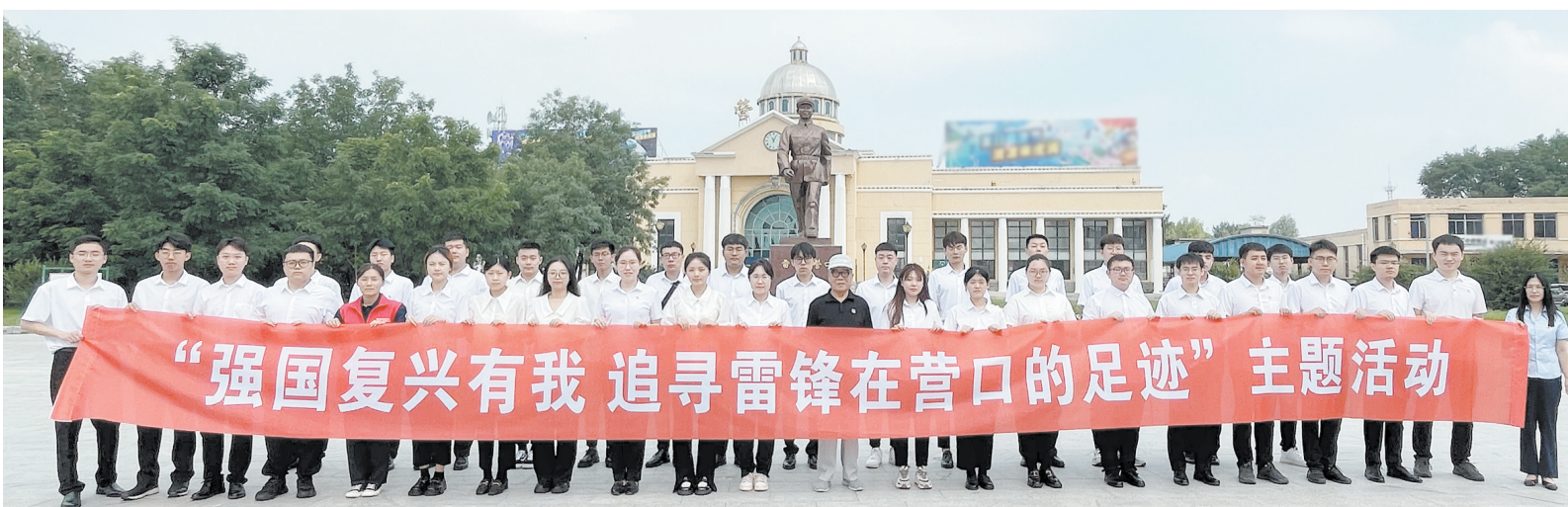
2023年8月15日，市雷锋文化博物馆与国网营口供电公司共同开展“强国复兴有我 追寻雷锋在营口的足迹”主题活动。