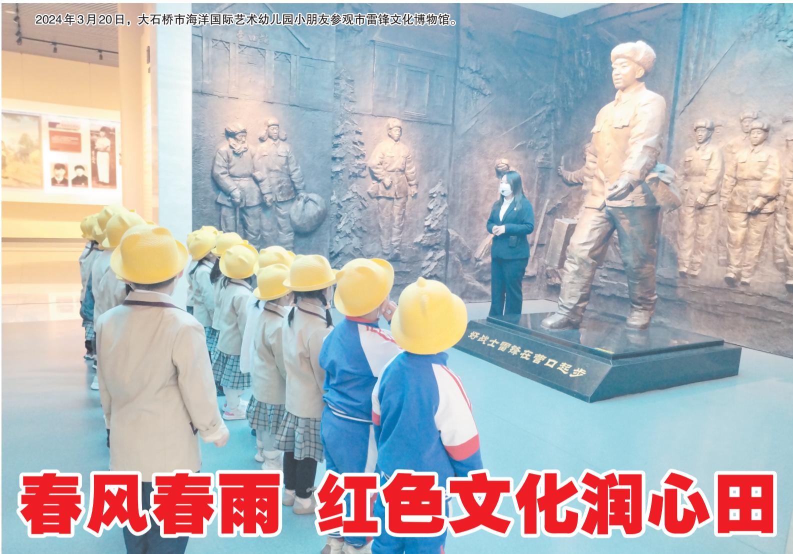
2024年3月20日，大石桥市海洋国际艺术幼儿园小朋友参观市雷锋文化博物馆。