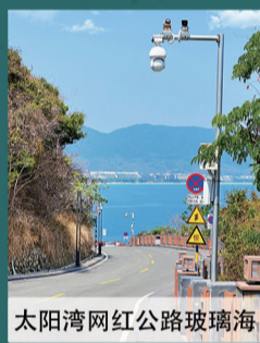
太阳湾网红公路玻璃海