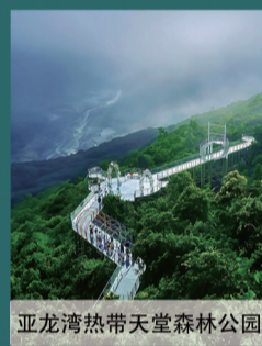
亚龙湾热带天堂森林公园