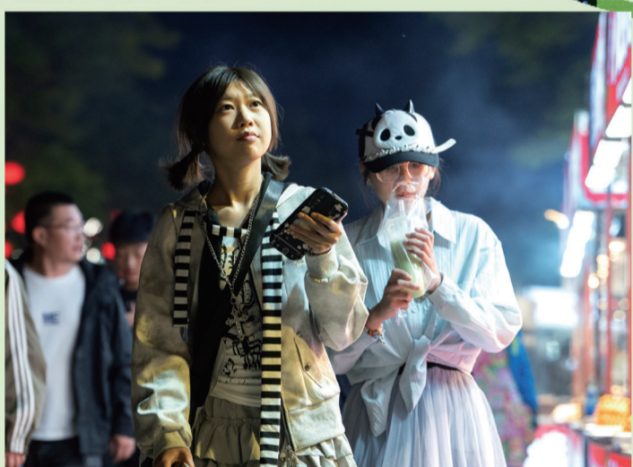
▲5月24日晚，营口辽河老街人潮涌动，游客们穿梭于特色小吃摊位间，边逛边品尝美食。

初夏的营口，海风轻拂，槐香四溢。随着文体旅融合发展的深入推进，这座辽东湾畔的滨海城市正以多元业态、创新体验和沉浸式场景，吸引着全国游客的目光。文化、体育与旅游的跨界联动，不仅为城市注入活力，更成为推动区域经济高质量发展的强劲引擎。