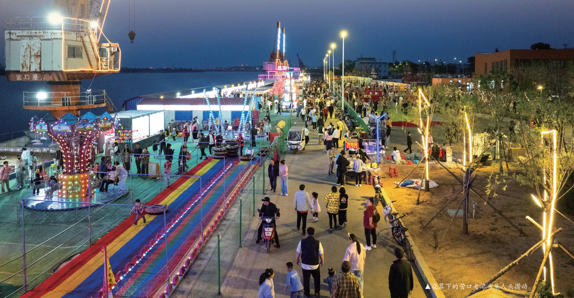
▲夜幕下的营口老港市集人头攒动。