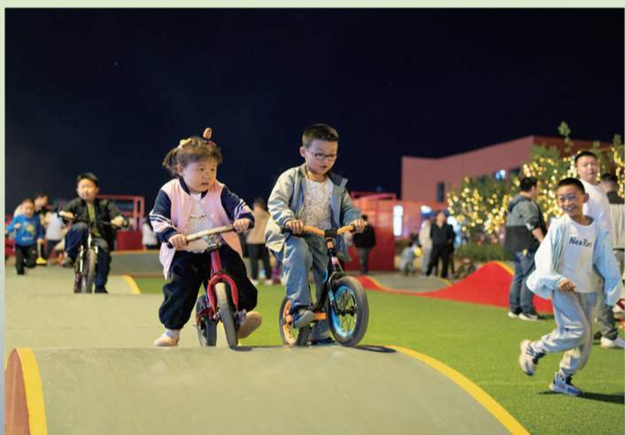
▲在营口老港市集，三五成群的小朋友们正开心地玩耍。