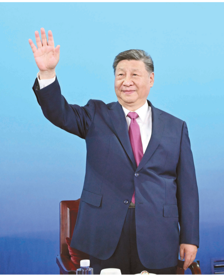
图为中共中央总书记、国家主席、中央军委主席习近平在主席台上向大家挥手致意。