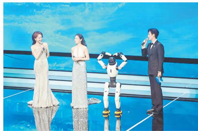
主持人在2025年中国金鸡百花电影节开幕式现场与机器人互动。