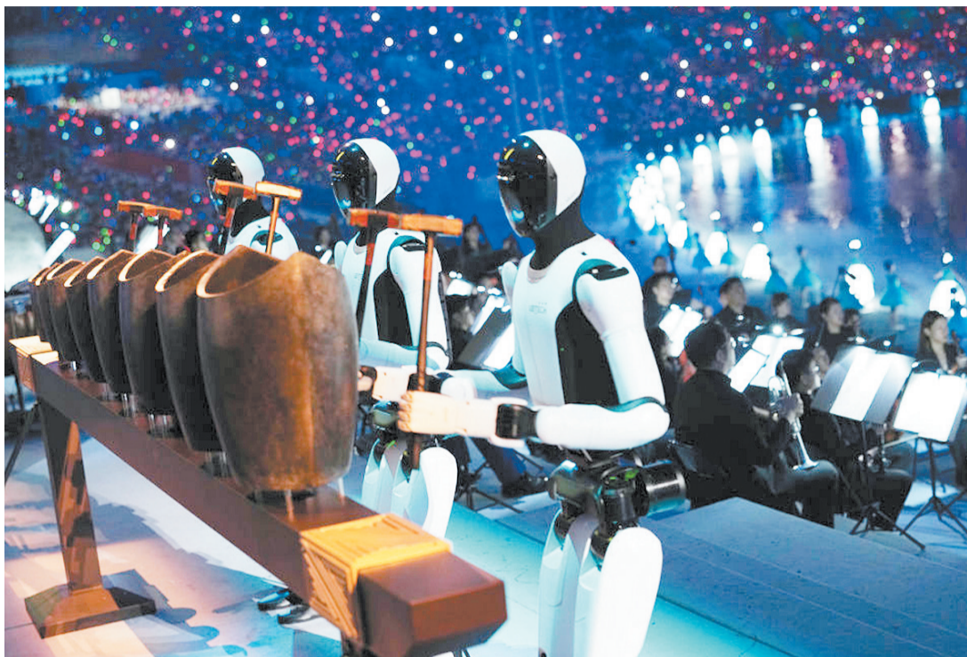
开幕式上的机器人表演。

智能人形机器人敲响古乐，醒狮在AIGC(人工智能生成内容)里“蹦迪”，英歌锣鼓“撞”上全息投影，龙舟通过AR(增强现实)技术“划”入观众席……近日举行的第十五届全国运动会开幕式上，科技与文化激情碰撞，惊艳四座。