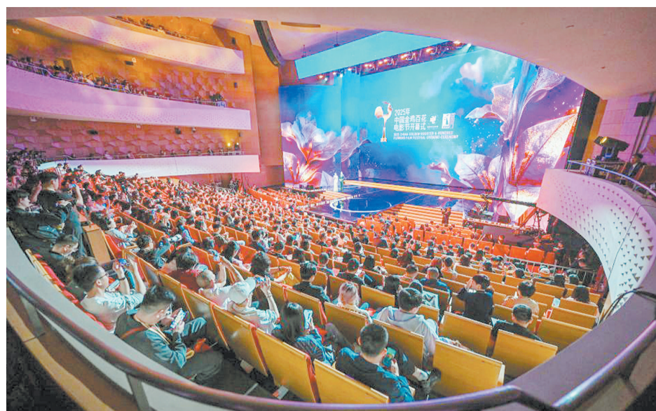
2025年中国金鸡百花电影节开幕式现场。