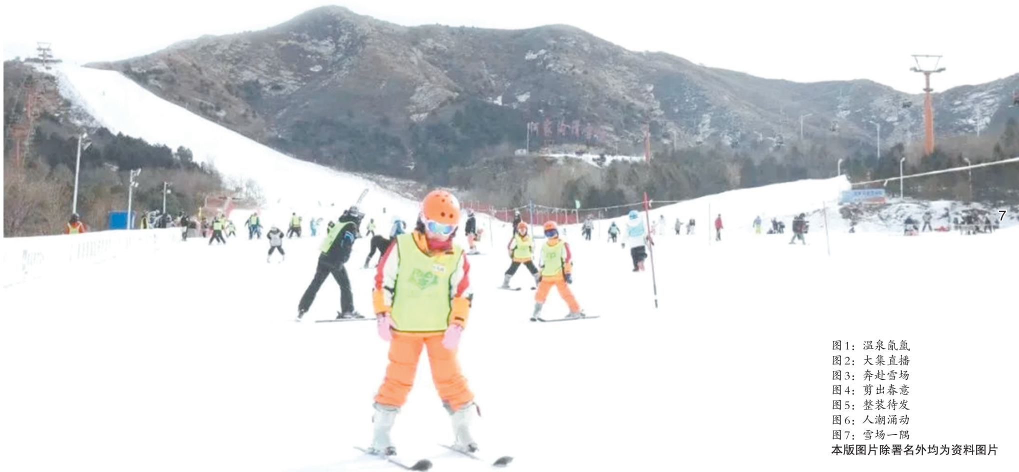
图1：温泉氤氲 图2：大集直播 图3：奔赴雪场 图4：剪出春意 图5：整装待发 图6：人潮涌动 图7：雪场一隅