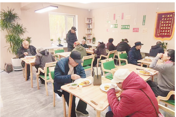
助老食堂桌椅摆放规整,环境明亮整洁。

这是2025年营口市居家社区助老食堂网络项目的一个缩影。作为我市重点民生实事之一,该项目总投资469万元,共建成60处居家社区助老食堂(含助餐点),较原计划超额完成10处,构建起覆盖城乡的“暖心食堂网络”,让老年人在家门口就能吃上放心饭、舒心饭。此项工程覆盖全市6个县(市)区,其中鲅鱼圈区23处、盖州市5处、大石桥市3处、老边区4处、站前区16处、西市区9处。居家社区助老食堂点多布局在老年人聚居区域,真正实现“在家门口享暖