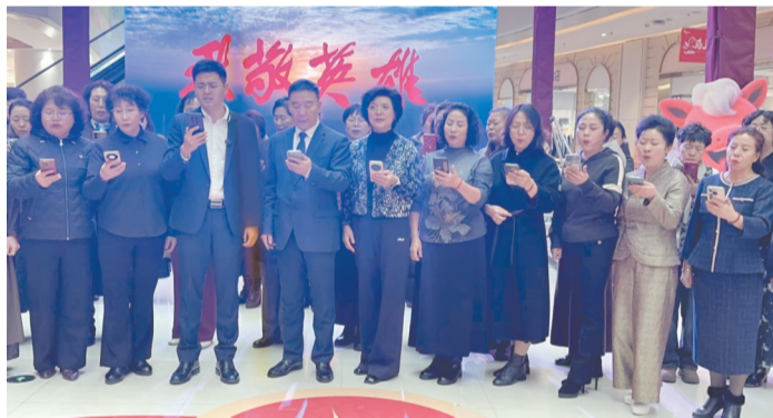
活动现场，大家集体朗诵《冰雪丰碑》。

3月5日是第63个学雷锋纪念日，一个用生命诠释雷锋精神的名字——金城龙，被追授“辽宁时代楷模”称号。这位26岁的辽宁中医药大学学生，1月23日为营救冰河落水父子不幸牺牲，用青春诠释了“无名无利无悔，有情有义有祖国”的誓言。消息传来，鲅鱼圈区老年大学的银龄党员们以实际行动掀起学习热潮，让雷锋精神在新时代绽放璀璨光芒。