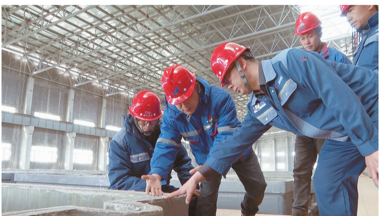
施工人员进行设备安装前的测量工作。

工程技术人员正在对配套工程的安装进行最后的细化。现场负责人介绍,该单体项目主要承担铜电解精炼生产任务,建成后实现年产30万吨高纯阴极铜产品,广泛应用于军工、电力电子、新能源等加工制造业。同时,副产品阳极泥可以提炼金、银等贵金属。