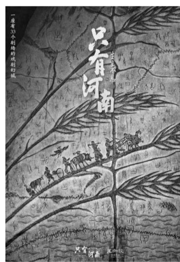
“只有河南·戏剧幻城”系列海报之一。