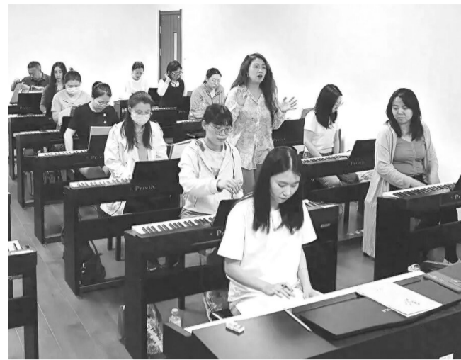
学员在辽宁省文化馆夜校学习数码钢琴演奏。