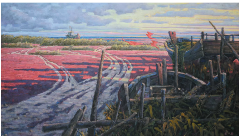
胡文举 《秋色尽染辽河岸》