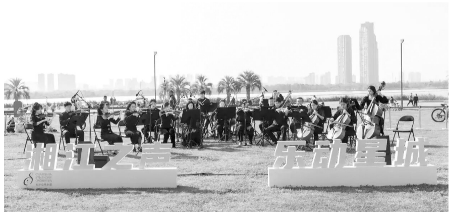
长沙交响乐团“湘江之声·乐动星城”城市交响惠民演出活动现场。

“把音乐会搬到户外，让高品质音乐真正贴近群众、扎根生活，既是高雅艺术拓宽传播渠道的生动实践，也是推动优质文化资源从‘单一供给’转变为‘多元供给’‘交互供给’的有效探索。”长沙交响乐