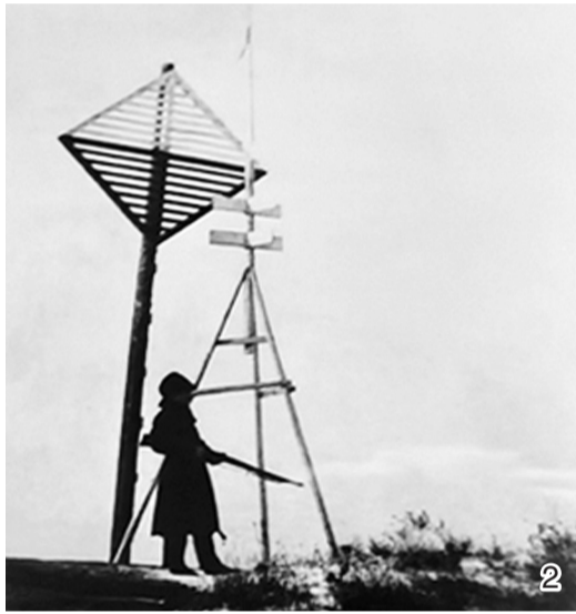
图2：占领营口的日军在大辽河入海口设立的哨卡。