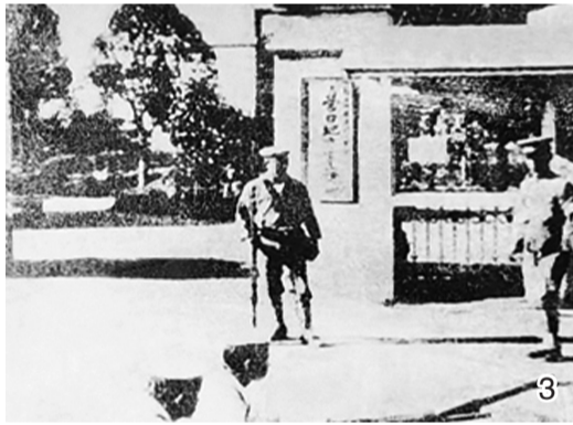
图3：日军在营口地方事务所门前设立的岗哨。