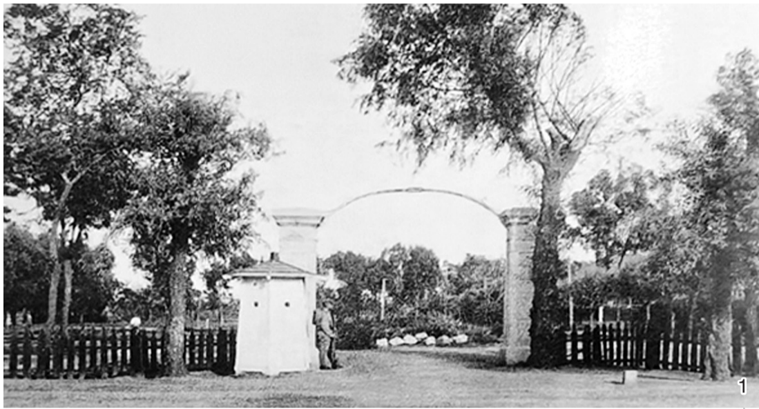
图1：驻大石桥日军守备队的营门。

1932年3月1日，伪满洲国成立后，关东军积极策划成立伪满洲中央银行。1932年3月8日设立“满洲中央银行”委员会，3月15日召开伪满洲中央银行筹备会议，由日本人五十岚保司任委员长，委员若干，开始了伪满洲中央银行的筹建工作。同年6月先后发布了《满洲国货币法》《旧货币整理法》《交通机关的新旧货币法》《中央银行法》。6月15日合并东三省“四行号”，成立了“满洲中央银行”，并于1932年7月1日开业。