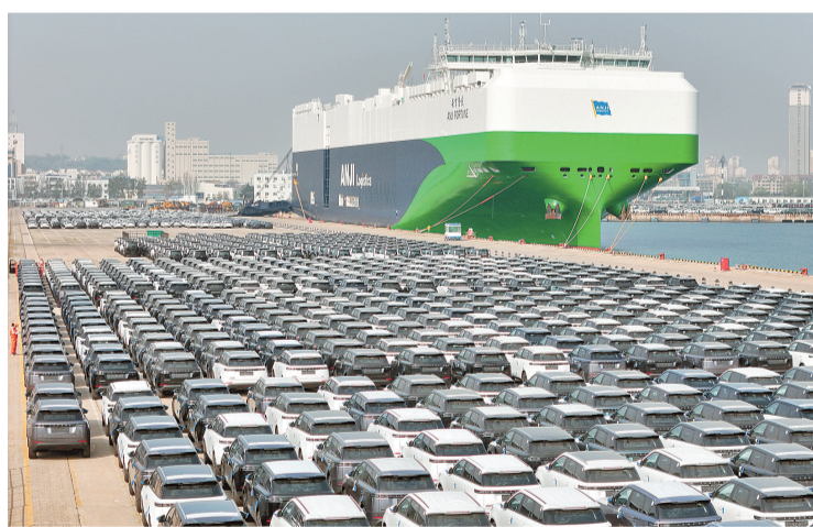
4月14日，国产汽车在山东港口烟台港等待装船出口(无人机照片)。

新华社北京4月14日电(记者 邹雨沁、邹多为)海关总署14日发布数据显示，2026年一季度我国货物贸易进出口总值11.84万亿元，同比增长15%，季度规模首超11万亿元的同时，季度增速创近5年最高。“起势有力、开局良好。”海关总署副署长王军在当天国新办举行的新闻发布会上表示，复杂严峻的外部环境下，一季度我国进出口能够实现较快增长，关键在于我国外贸基础稳、活力足、动能强。基础稳，主要体现在大盘稳中有进、市场多元稳定。到今年一季度，我国进出口总值已连续12个季度保持在10万亿元以上，增速自2022年四季度以来重回两位数增长。一季度，我国对东盟、拉美进出口均增长15.4%，对非洲进出口增长23.7%，对欧盟、英国进出口分别增长14.6%、13.1%，有效弥补了对美国进出口下降的缺口。