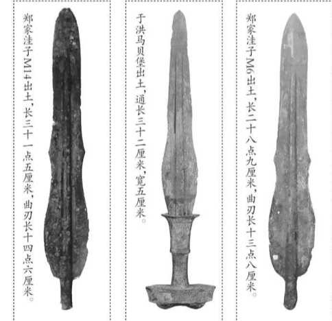
郑家洼子出土的青铜剑，牵出了一段横跨东北亚数千年的文化传奇。