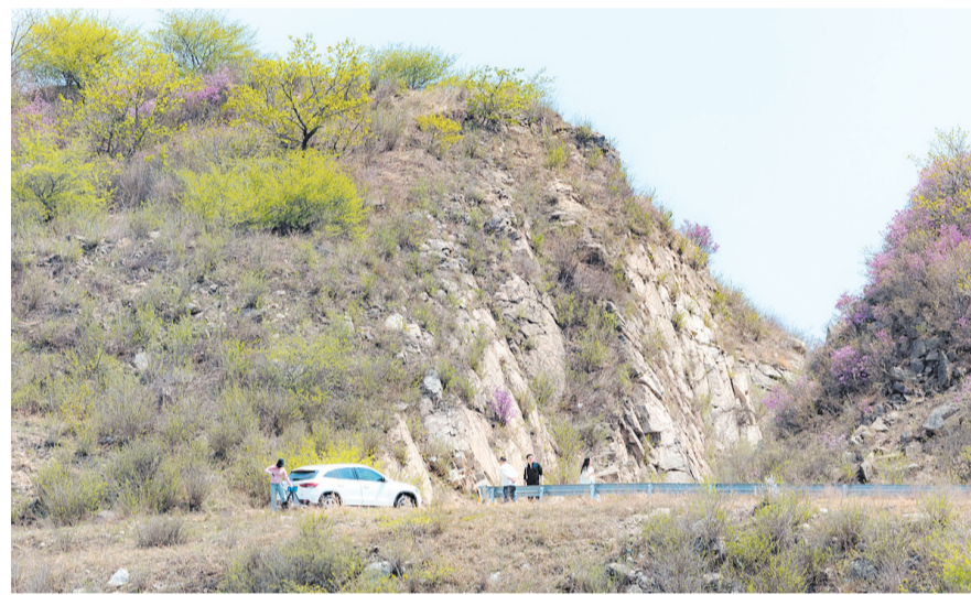
用行动守护着家乡美景。