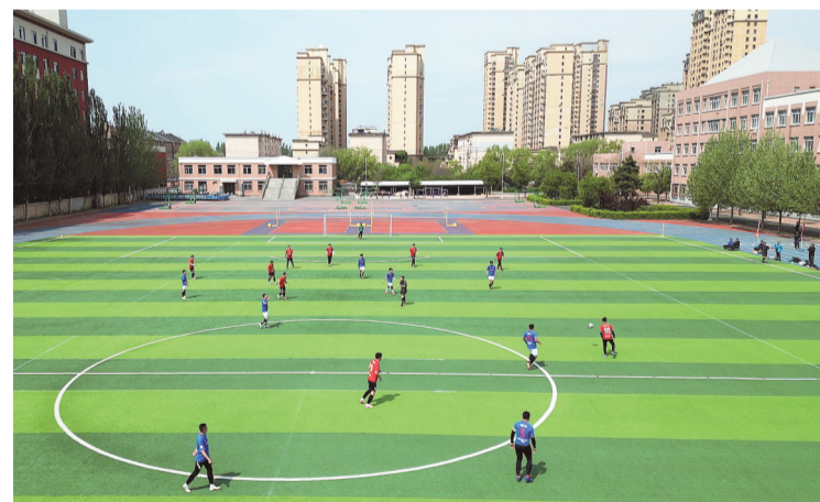
2026营口市首届城市足球联赛开赛,图为比赛现场。

本次读书班采取个人自学和集中研讨相结合的方式,与会领导同志认真研读《习近平同志关于树立和践行正确政绩观论述摘编》《习近平同志在浙江工作期间树立和践行正确政绩观的理论和实践》《树立和践行正确政绩观生动实践》等学习书目和资料,结合思想和工作实际,深入交流学习心得体会。