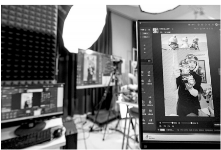
浙江嘉兴，一位网络主播正在直播卖货。