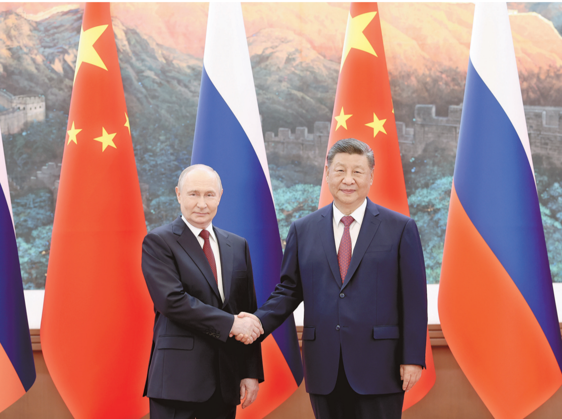
5月20日上午,国家主席习近平在北京人民大会堂同来华进行国事访问的俄罗斯总统普京举行会谈。